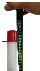
หัวปรับแน่น จะสูงประมาณ 86 ซม.