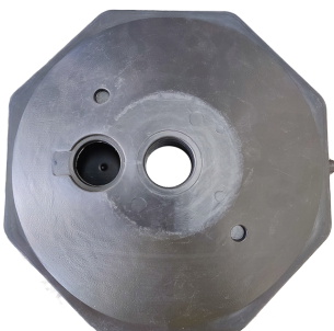
ฐานมีช่องใส่น้ำหรือทราย