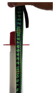
หัวปรับยืด จะสูงประมาณ 90 ซม.